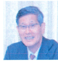
認定NPO 全世代代表理事 尾身茂

医師不足で悩む地域であなただのキャリアを生かした第二の人生を歩みませんか。皆様の応募をお待ちしております。